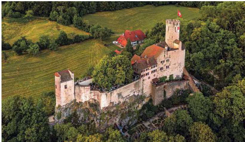
Was für eine prachtvolle Kulisse für ein Festival mit Livemusik: Schloss Neu-Bechburg in Oensingen.

Das Festival, das nun im Juni in die dritte Runde geht, hebt sich alleine schon von der Location von anderen, ähnlich ge-