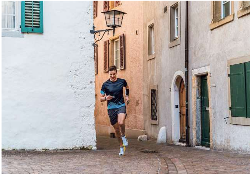
Auch durch diese Oltnr Gasse werden die Athletinnen und Athleten übermorgen und am Sonntag rennen.