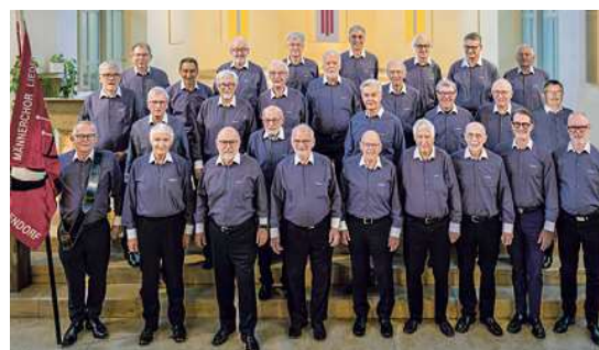
Der Männerchor Hägendorf in aktueller Besetzung im Jubiläumsjahr.